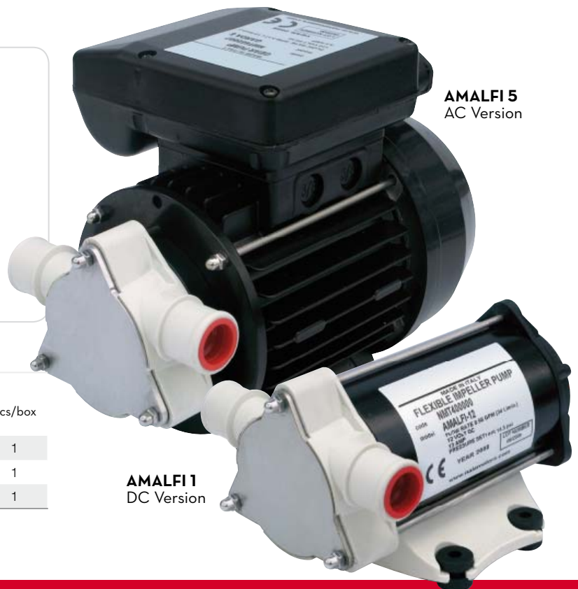
AMALFI 5 AC Version